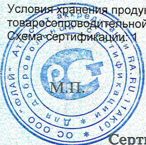
Схема сертификации: 1

Условия хранения продукции, срок хранения (службы, годности) указан в прилагаемой к продукции товаросопроводительной и/или эксплуатационной документации.